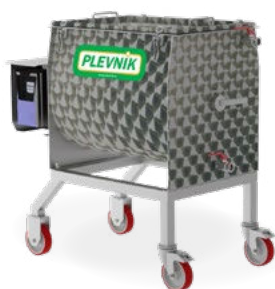
Untergestell auf Rädern